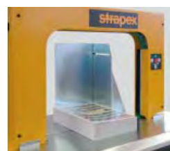
Buntstoppere sikker båndplassering på løse bunter