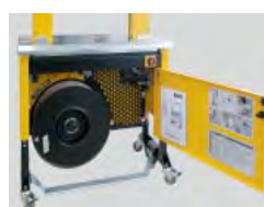
Robust og kompakt